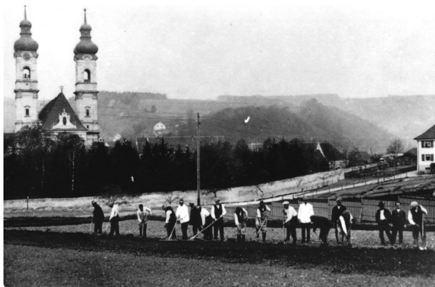
Patienten bei der Feldarbeit 1935