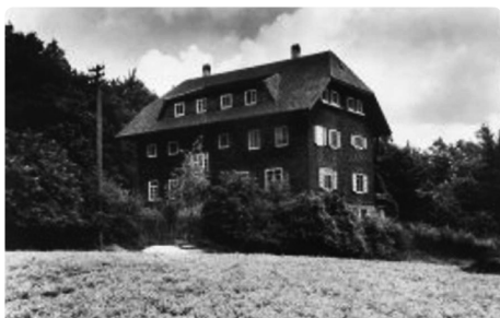
Haupthaus der Landschulheime

In Herrlingen, seit 1976 Teilort der Gemeinde Blaustein, entstand in der 1. Hälfte des 20. Jahrhunderts eine beeindruckende pädagogische Provinz jüdisch-deutscher Reformpädagogik und zugleich ein Ort, der Teil der sog. Endlösung der Judenfrage durch die Nazis wurde.