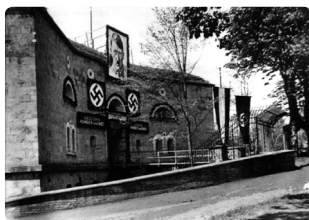
Blick auf die ehemalige KZ-Kommandantur in einer Propagandainszenierung zum 1. Mai 1934.

Von November 1933 bis Juli 1935 befand sich im Ulmer Fort Oberer Kuhberg (erbaut um 1850 als Teil der Bundesfestung Ulm) ein frühes nationalsozialistisches Konzentrationslager für das Land Württemberg. Dort waren mehr als 600 Regimegegner inhaftiert, unter ihnen der sozialdemokratische Reichstagsabgeordnete Kurt Schumacher. Die Funktion des Lagers war es, die politischen und weltanschaulichen Gegner durch Terror in ihren Überzeugungen und ihrer Persönlichkeit zu brechen und die übrige Bevölkerung einzuschüchtern.