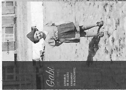
Cover des Buches von Leo Hiemer