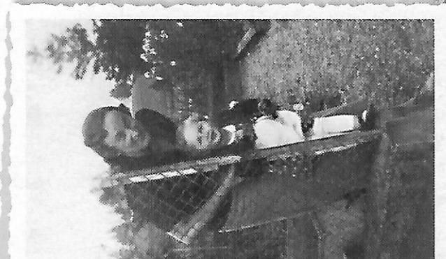
mit ihrer Mütti