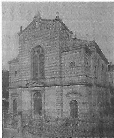
Die Konstanzer Synagoge um 1895