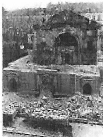
Einige Tage nach der Sprengung 1938